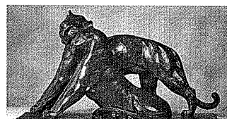
Becquerel, Le Repos , v. 1940, H. 33 cm.

Les organisateurs du salon Paris Fine Art lancent une édition d'hiver. Si la qualité était au rendez-vous du premier opus en septembre, sa faible fréquentation aurait pu dissuader certains marchands de revenir en février. Fin décembre, une douzaine de galeries intéressantes étaient annoncées, telles Univers du Bronze, Martel-Greiner, Delvaile ou Philippe Mendes. C. L.